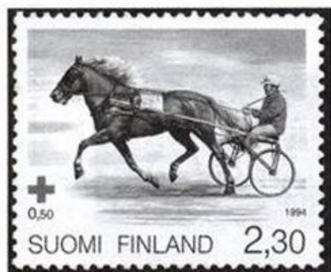
Рысистые бега, Финляндия

и Бразилии (№ 957), а афганские (№ 1237) и казахстанские (№ 200) почтовые миниатюры знакомят с такими национальными конными состязаниями, как бузкаши и кок-пар.