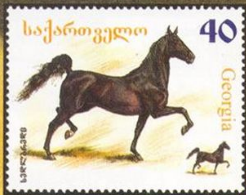
Американская верховая, Грузия