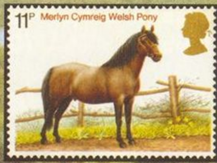
Уэльский пони, Великобритания