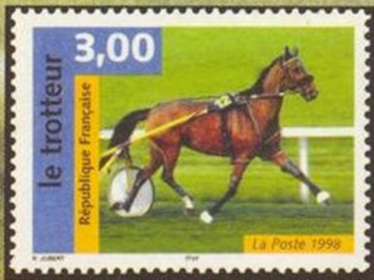
Французский рысак, Франция