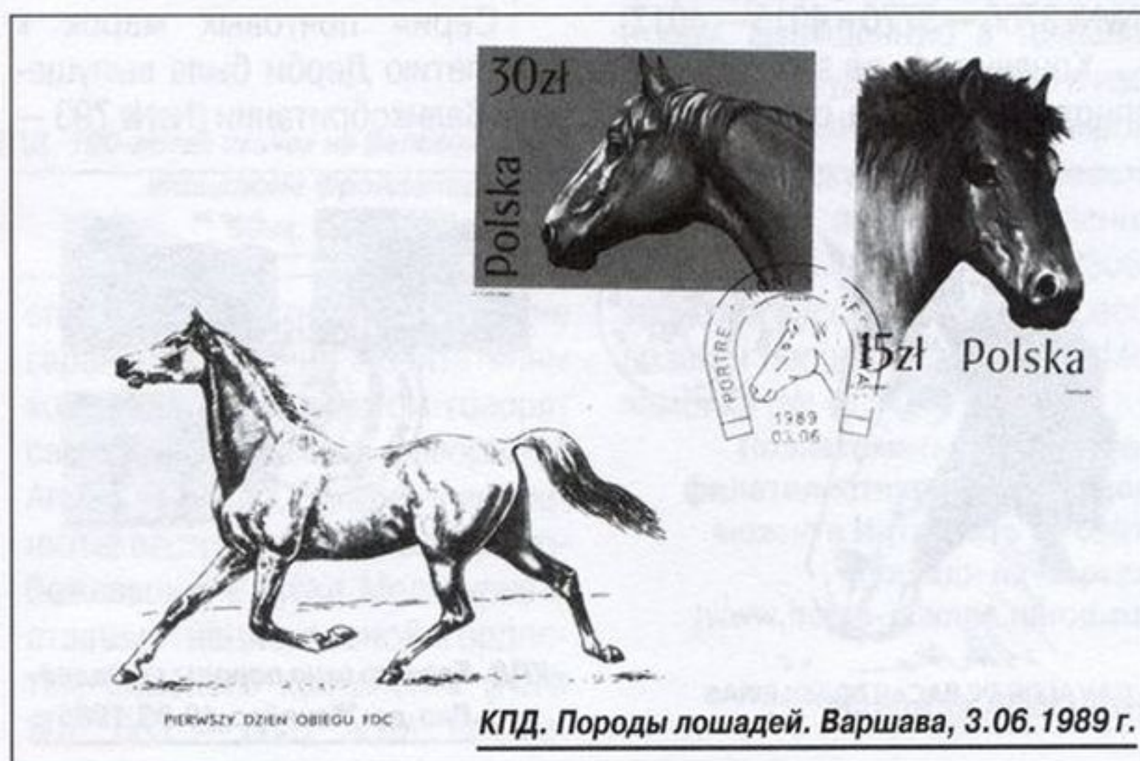
КПД. Породы лошадей. Варшава, 3.06.1989 г.

Испания выпустила марку (№ 2783) по случаю проведения