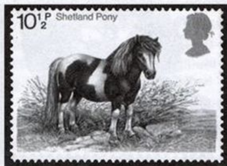
Шетлендский пони, Великобритания

экзотических лошадей мангаларга маршадор и камполина (№№ 2097 — 2099), Франции — камаргских лошадей и пони поток (№№ 332 — 3329). На отечественных марках присутствуют орловский рысак и лошадь будённовской породы (№№ 3460 и 3462). Благодаря маркам Вануату (№ 1158) и Новых Гебридов (№№ 368, 370) можно узнать о существовании диких лошадей тана, обитающих на этих островах. Почтовое ведомство Австралии знакомит с австралийскими пони (№ 971) и дикими лошадьми брамби (№ 968). На маленьком