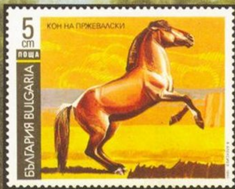
Лошадь Пржевальского, Болгария