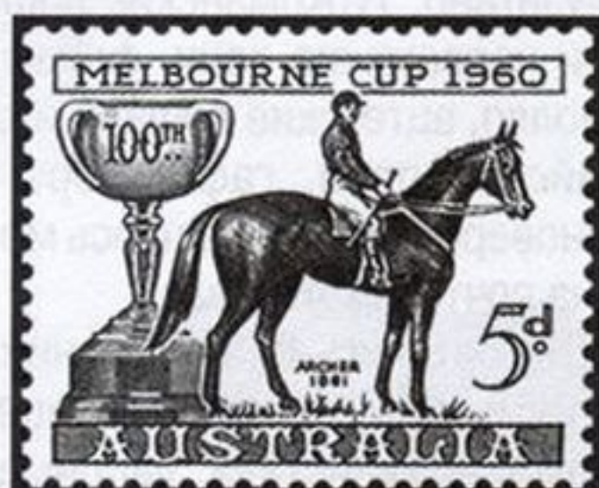
Archer — победитель первого кубка Мельбурна, Австралия

популярного в этой стране большого ежегодного конного праздника «Фериа-дель-кабалло» в городе Херес-де-ла-Фронтьера. Ирландский выпуск посвящён национальным фестивалям, в том числе большой конной ярмарке в Баллинасло (№ 632), во время которой тихий и сонный городок превращается в шумный цыганский табор, где человеческие голоса перекрываются лошадиным ржанием. В Великобритании к 50-летию Общества любителей британских лошадей выпущена в обращение серия из четырёх марок (№№ 1701 — 1704), на которых изображены обитатели королевского конного двора. Почтовое ведомство Венгрии отметило памятными сериями 200-летние юбилеи конных заводов в Баболне и Мезёхедьеше (№№ 3766 — 3770 и 4015 — 4017).