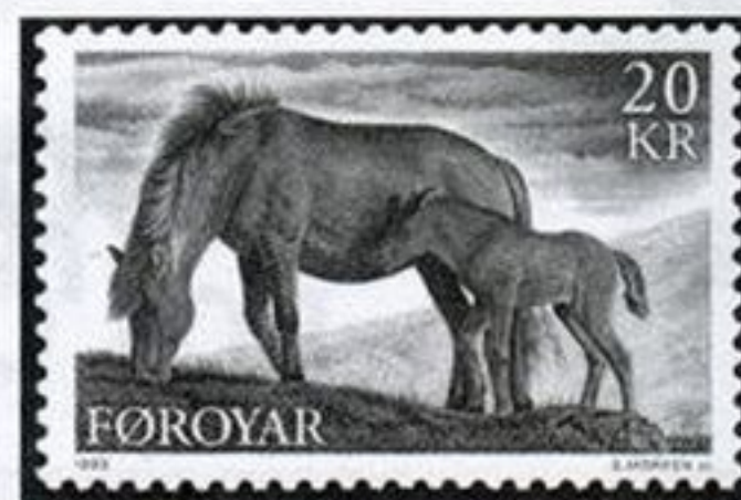
Фарерский пони, Фарерские о-ва