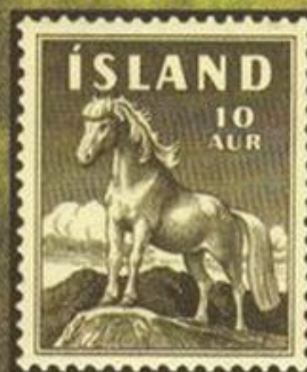
Исландский пони, Исландия