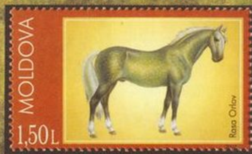
Орловский рысак, Молдавия