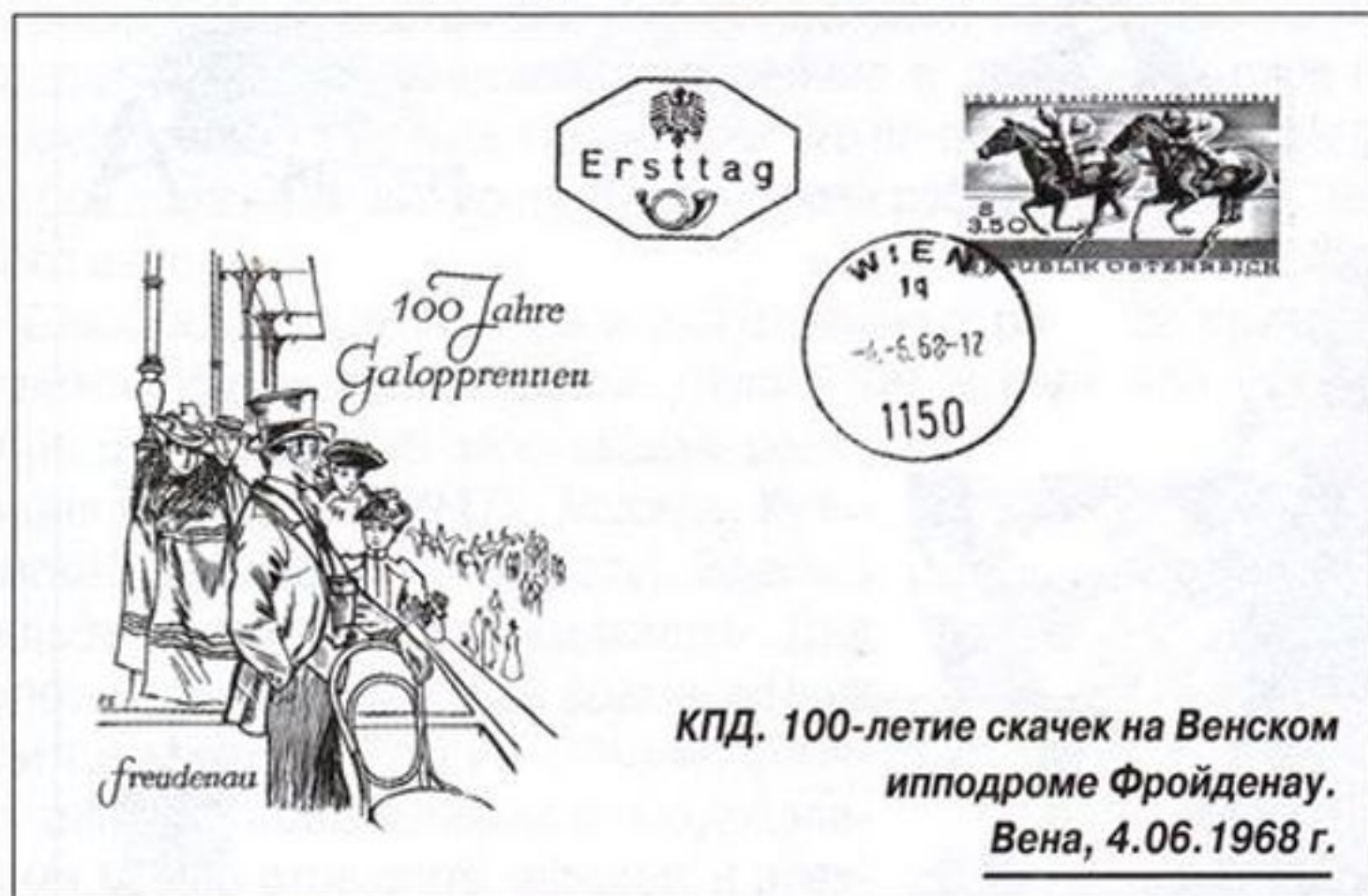
КПД. 100-летие скачек на Венском ипподроме Фройденау. Вена, 4.06.1968 г.

Другие конноспортивные дисциплины на почтовых миниатюрах изображаются несколько реже. Упряжной спорт (драй-