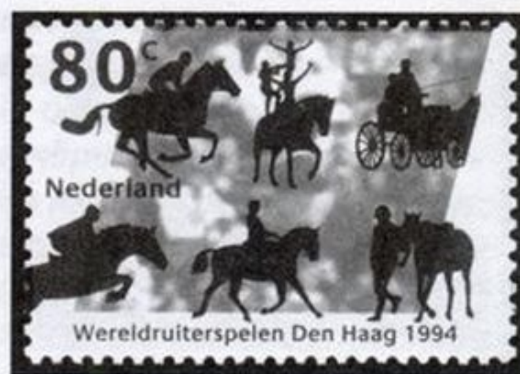
Всемирные конные игры 1994 года в Гааге, Нидерланды

796); 250-летие первого стипль-чеза отметила Ирландия (№№ 1415 — 1418). В США вышла в обращение марка, посвящённая сотому проведению Кентукки Дерби (№ 1135). Даже во времена Третьего рейха к 70-летию Дерби в Германии появилась прекрасная марка (№ 698). В честь знаменитого на весь мир Пардубицкого стипль-чеза в Чехословакии выпущены три серии (№№ 2469 — 2474, 3060 — 3061), хотя на одну из марок (№ 2970) непонятным образом затесалась пара рысаков с качалками.